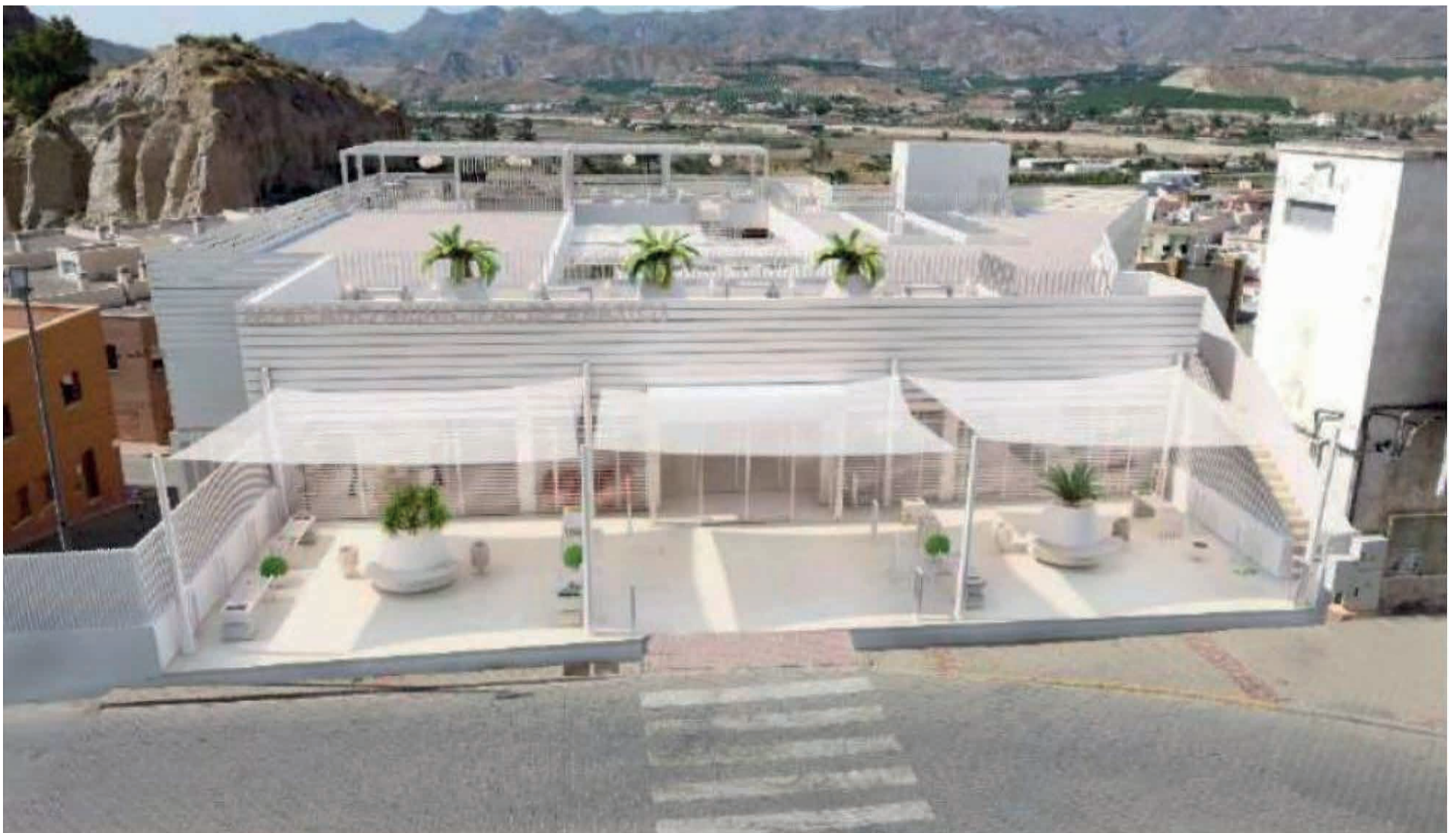
Rcreación mercado de abastos

ENTRE LOS PROYECTOS PRESENTADOS SE ENCUENTRAN LA REMODELACIÓN INTEGRAL DE LA PLAZA DE ABASTOS, LA CIUDAD DE LAS ARTES ESCÉNICAS, LA RENOVACIÓN DE REDES DE ABASTECIMIENTO Y EL PLAN DE SOSTENIBILIDAD TURÍSTICA, ENTRE OTROS