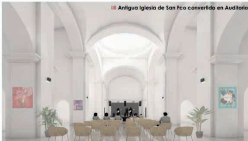
Antigua Iglesia de San Fco convertido en Auditorio